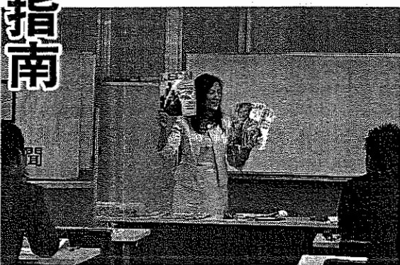
自分に合ったファッション雑誌の選び方を説明